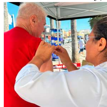
Grupos prioritários são foco da ação