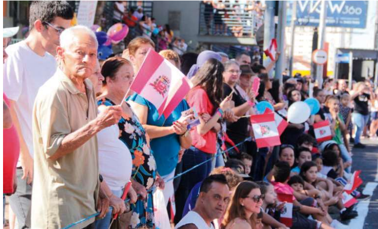
Registro de comemoração de ano anterior na cidade; agenda segue durante o mês

Às 8h, será realizado o hasteamento das bandeiras em frente à Prefeitura. Em seguida, a par-