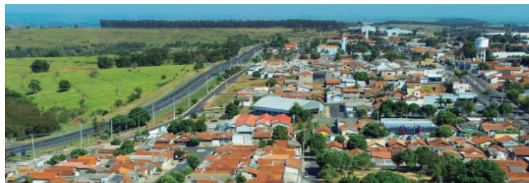
Município promove grande programação com atendimento à população no dia 18