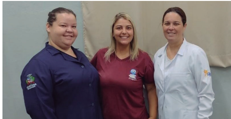
Ações realizadas focaram na prevenção de doenças e no fortalecimento do ensino

Durante a formação, foram apresentadas estratégias de ensino e promovidos mo-