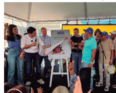
Entrega oficial foi realizada no sábado (11)