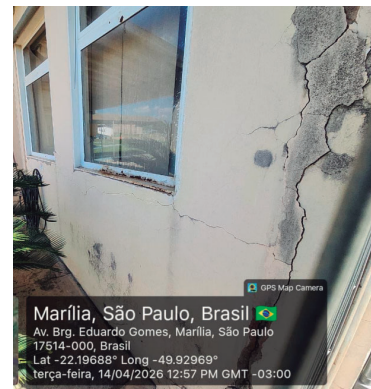
Esquadrias das janelas com corrosão