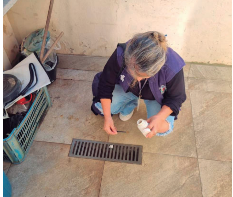
Ação de combate à dengue visitou mais de mil casas nos bairros Palmital e Castelo Branco