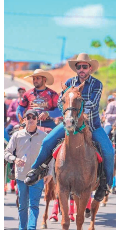
Evento integra calendário comemorativo

Valor da publicação: R$ 9,86. Conforme Lei Municipal Nº 2.650, de 30 de março de 2016