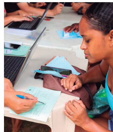
Desconto chega a 71 mil pessoas na região

Valor da publicação: R$ 56,00. Conforme Lei Municipal Nº 2.650, de 30 de março de 2016