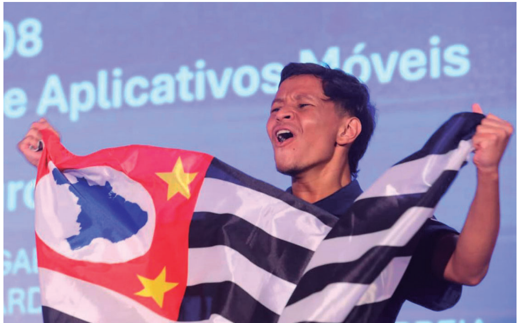
Morador de Quintana conquista vaga após títulos e se prepara para representar o Brasil em mundial de tecnologia na China