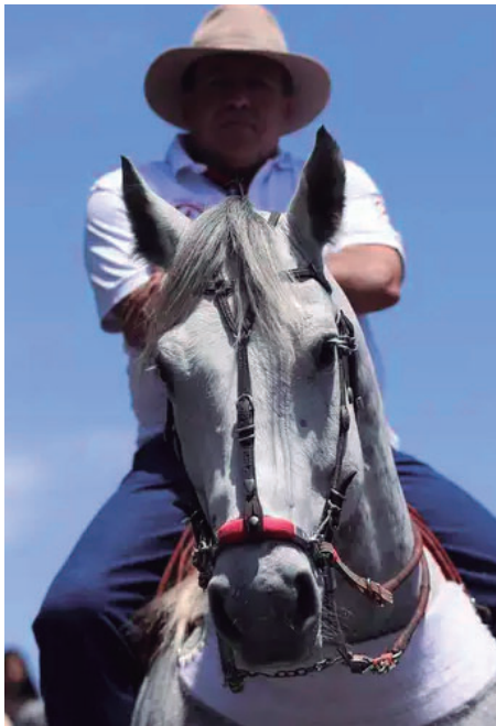
Evento celebra os 77 anos com programação festiva