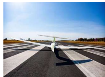
Voos de planadores foram restabelecidos

Valor da publicação: R$ 56,00. Conforme Lei Municipal Nº 2.650, de 30 de março de 2016