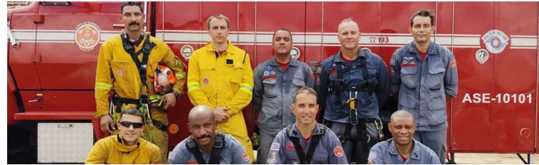
Equipe do Corpo de Bombeiros que participou do complexo resgate em Marília