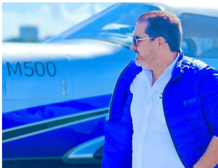
Empresário foi extraditado da Espanha e transferido para prisão na Bolívia