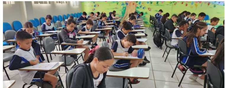
De acordo com dados de 2025, o município alcançou 72% de alunos alfabetizados