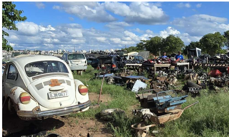
Fiscalização constatou o armazenamento inadequado de pneus e garrafas