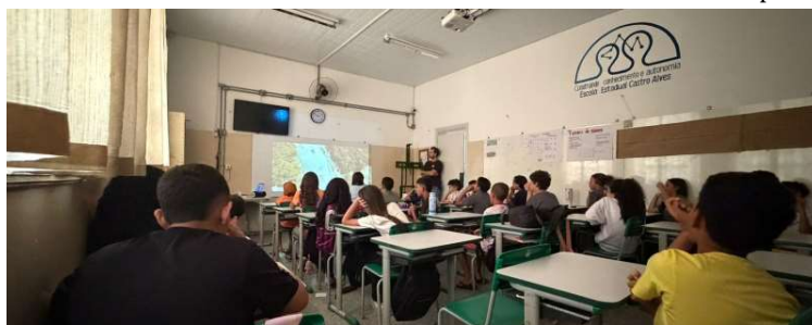
Iniciativa registrou um crescimento expressivo em relação ao ciclo anterior

Os estudantes assistiram a filmes como Águas Turvas, Viduas sobre as Águas e Águas SP – São Paulo pede água, além das animações Chuva, Maré Braba e Aurora: A rua que queria ser um rio. Após as exibições, professores e mediadores conduziram rodas de conversa e atividades educativas, abordando temas como escassez hídrica, ciclo da água, preservação dos rios e convivência sustentável com a natureza.