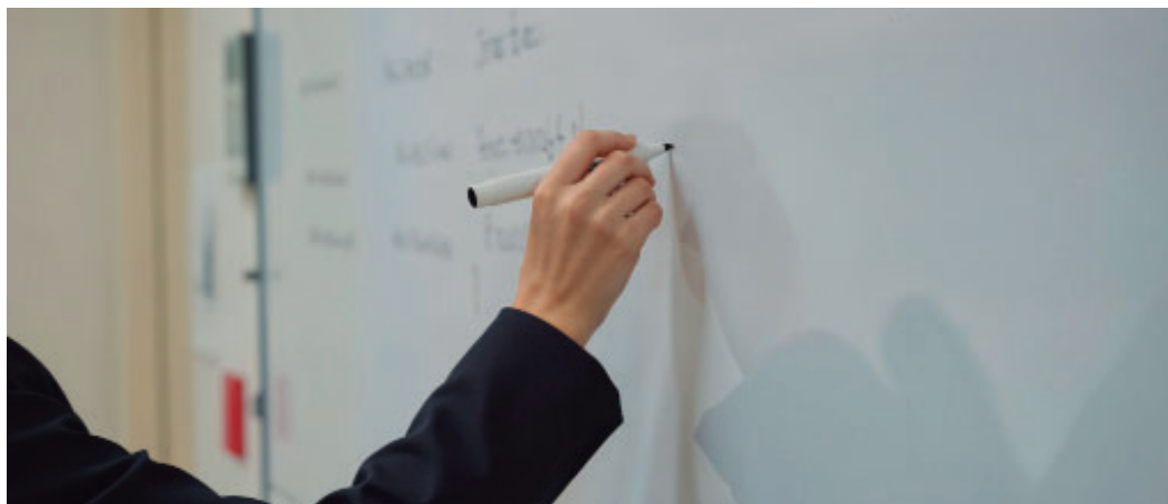
De acordo com a lei, foi reorganizado quadro de cargos do magistério previsto em 2022

Para entender as alterações, é preciso conhecer a estrutura do cargo. PEB é a sigla de Professor de Educação Básica, categoria que reúne os docentes da rede pública municipal e se divide em três níveis. Os cargos de PEB I e PEB II contemplam os professores do