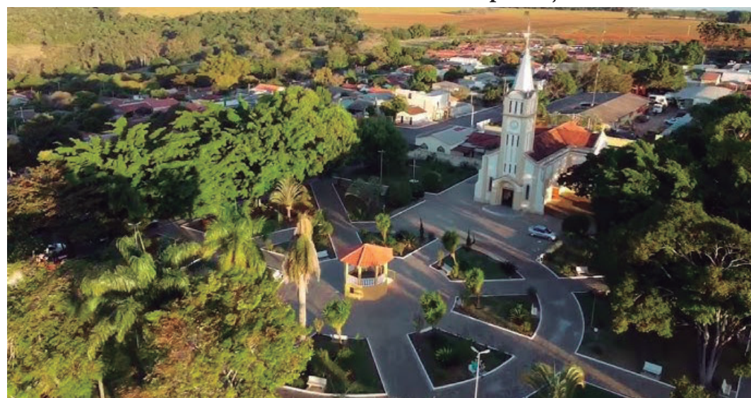
Município conquistou reconhecimento por transparência e eficiência no uso de verbas

Valor da publicação: R$ 56,00. Conforme Lei Municipal Nº 2.650, de 30 de março de 2016