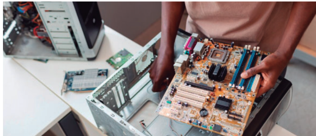
Edital prevê contratação de empresa especializada na prestação de serviços de informática

De acordo com o levantamento realizado pela administração municipal, foram consultadas empresas especializadas na