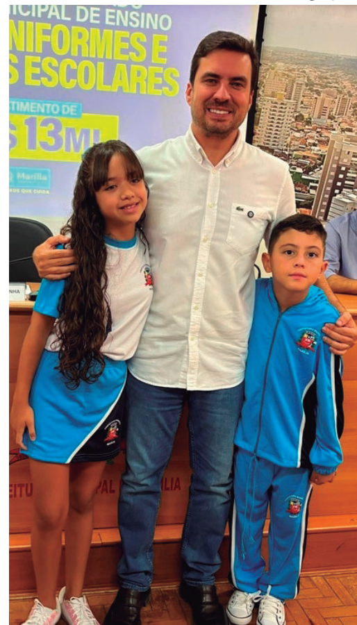
Prefeito confirmou entrega nesta semana