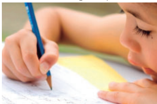
Medidas foram publicadas no Diário