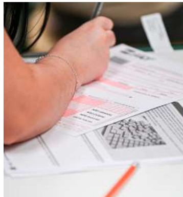
Vestibulinho tem 33 mil vagas no Estado

e derivados da cana-de-açúcar. Durante o curso, os alunos estudam conteúdos relacionados à matemática, biologia e química aplicadas aos processos industriais, com foco na produção e no controle de qualidade do açúcar e