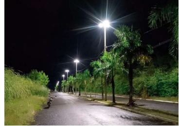
Iluminação adequada promove segurança