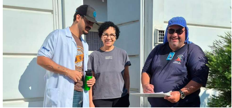
Equipes estarão concentradas na área atendida pela UBS do Santa Antonieta

De acordo com a Secretaria Municipal da Saúde, Marília segue com a dengue sob controle, contabilizando atualmente 74 casos confirmados da doença e nenhum registro de caso grave.