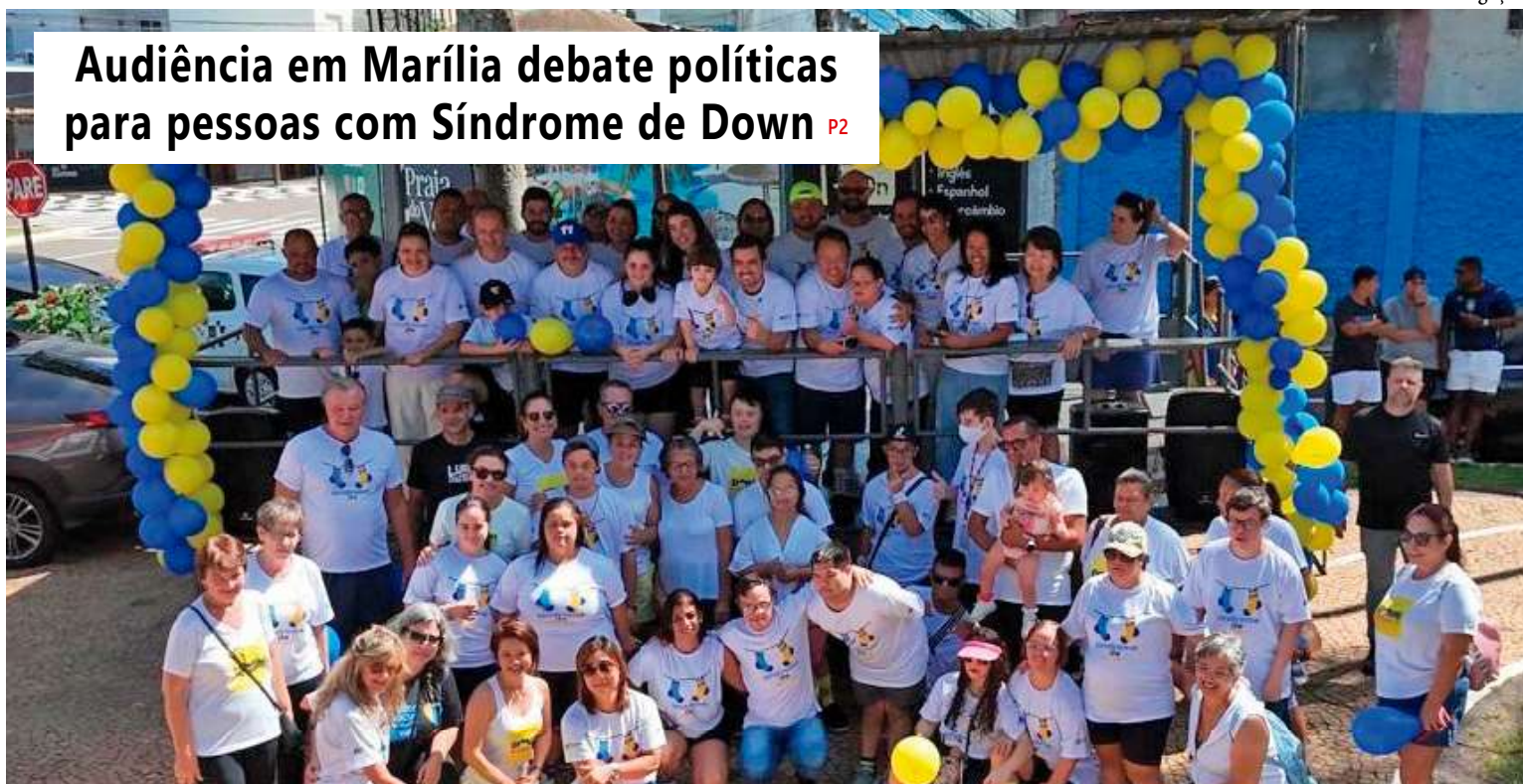
Registro da Caminhada do Dia Internacional da Síndrome de Down; Câmara de Marília recebe nesta sexta-feira, dia 29, às 16h, no Plenário, audiência para o debate de políticas, inclusão e acolhimento

Audiência em Marília debate políticas para pessoas com Síndrome de Down P2