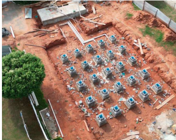
Praça terá fontes interativas de água

tamente do chão, permitindo que crianças e adultos circulem pelo espaço, utilizem a estrutura para recreação e se refresquem durante os períodos de calor. A proposta busca unir lazer, urbanismo e conforto térmico em um ambiente acessível e gratuito.