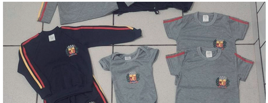
Kits completos foram entregues aos alunos das escolas municipais e da creche

Valor da publicação: R$ 28,00. Conforme Lei Municipal Nº 2.650, de 30 de março de 2016