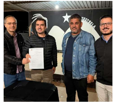
Entrega reuniu moradores e autoridades

Valor da publicação: R$ 56,00. Conforme Lei Municipal Nº 2.650, de 30 de março de 2016