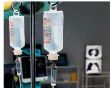
Aquisição busca reforçar as unidades