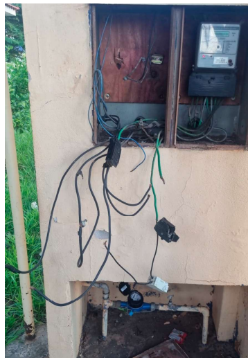
Caso é investigado pela Polícia Civil

Em nota, a Prefeitura de Marília, por meio da Secretaria Municipal da Saúde, infor-