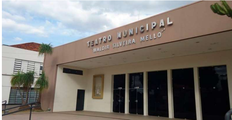
Proposta abre caminho para que Marília possa executar mais ações culturais

Na prática, a proposta abre caminho para que Marília possa receber recursos estaduais voltados ao custeio de atividades culturais e iniciativas destinadas