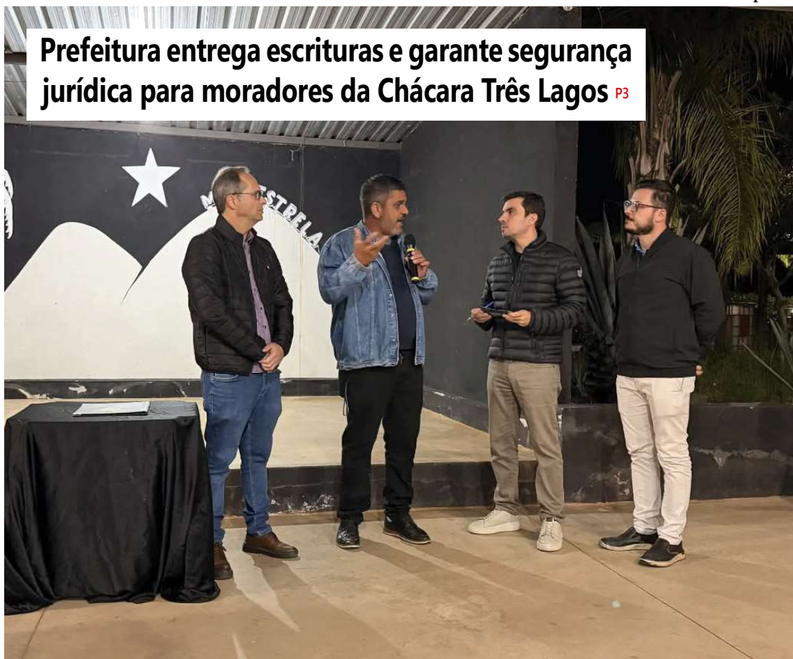
Ato foi formalizado durante evento na sede da Associação Montestrela, com a assinatura da Regularização Fundiária Urbana

Prefeitura entrega escrituras e garante segurança jurídica para moradores da Chácara Três Lagos P3