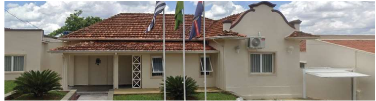
Município tem edital estimado em quase R$ 3,3 milhões para eventos e festividades