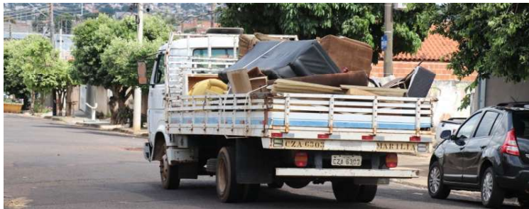
Nova etapa do programa será iniciada na próxima segunda-feira na zona Sul

Os trabalhos serão executados pela Secretaria Municipal do Meio Ambiente e Serviços Públicos, com recolhimento de materiais inservíveis das 8h às 16h. A orientação aos moradores é para que os objetos sejam colocados nas calçadas, em frente às residências, logo no início da manhã, facilitando o