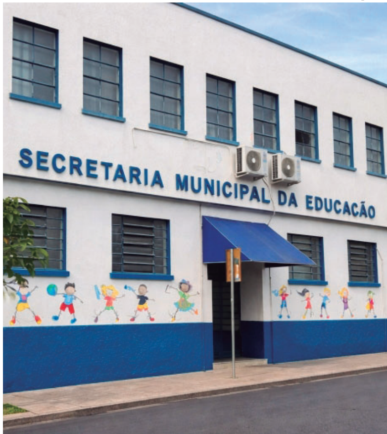
Edital prevê profissionais de apoio para atendimento de estudantes da educação especial