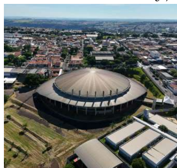
Município ficou entre os 100 melhores

Valor da publicação: R$ 56,00. Conforme Lei Municipal Nº 2.650, de 30 de março de 2016