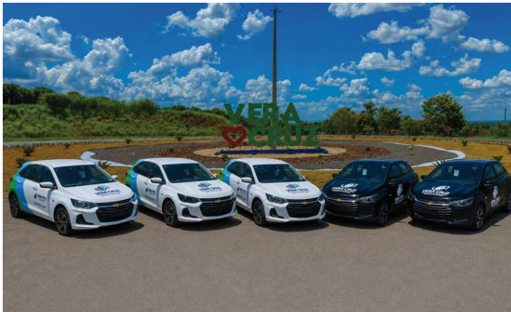
Veículos irão reforçar principalmente o transporte de pacientes para outros municípios

Na Saúde, foram incorporados três veículos que deverão ser utilizados, principalmente, no transporte de pacientes encaminhados para consultas, exames e tratamentos em outros municípios. De acordo com a Prefeitura, dois automóveis foram adquiridos por meio de emendas parlamentares do deputado federal Marangoni e um por indicação da deputada estadual Bruna Furlan, além de contrapartida municipal superior a R$ 30 mil.