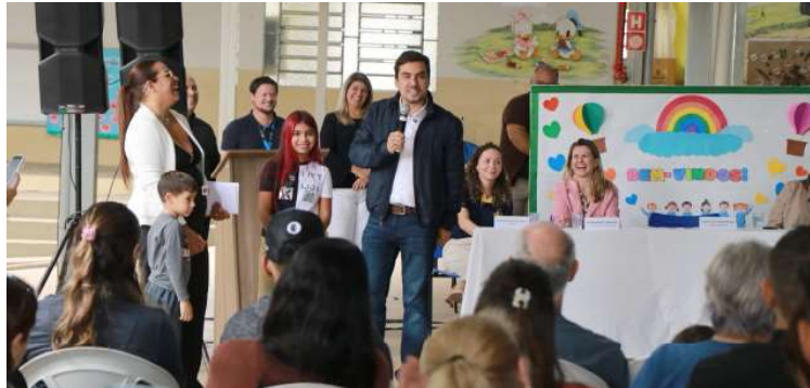
Cerimônia em Emei marcou o início da distribuição dos uniformes em Marília

investimento total nos uniformes escolares de verão e inverno supera R$ 6,9 milhões.