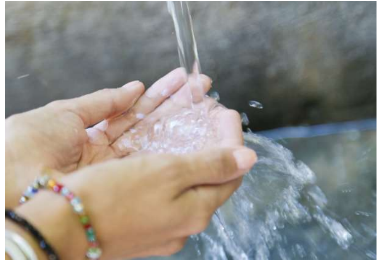
Contratação busca garantir abastecimento e manutenção da qualidade da água

Valor da publicação: R$ 28,00. Conforme Lei Municipal Nº 2.650, de 30 de março de 2016