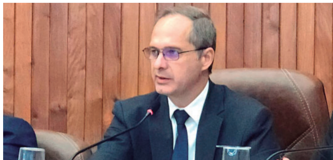
Iniciativa da audiência pública desta quarta-feira é do presidente da Câmara de Marília