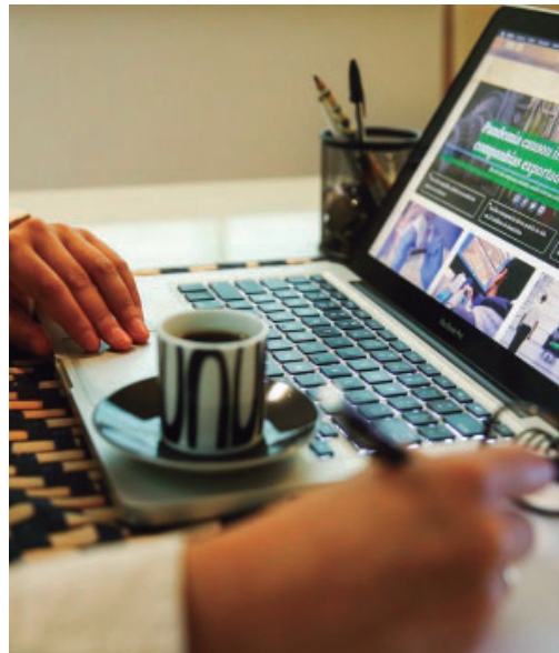
Teletrabalho não é um direito automático

dor em trabalho remoto deverá manter disponibilidade durante o expediente, atender convocações presenciais e se submeter à fiscalização da chefia.