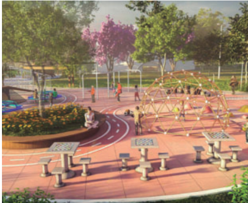
Projeto do futuro Parque da Criança

R$ 19,1 milhões são provenientes do convênio estadual, enquanto aproximadamente R$ 3,7 milhões correspondem a recursos próprios da Prefeitura.