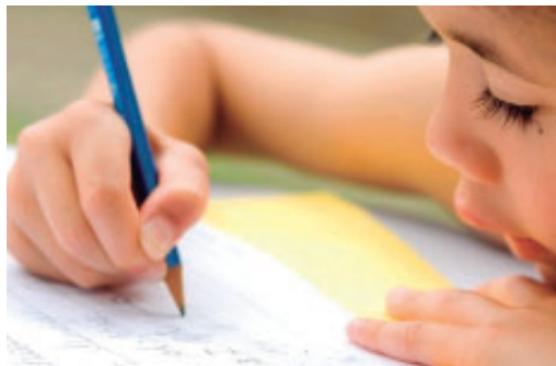
Medidas foram publicadas no Diário