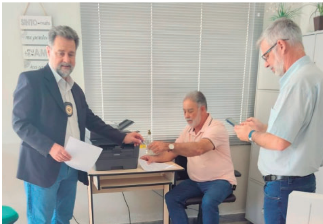
Ponto de Atendimento Virtual da Receita Federal foi inaugurado no município

dores poderão realizar diversos atendimentos, entre eles a regularização de CPF (Cada-