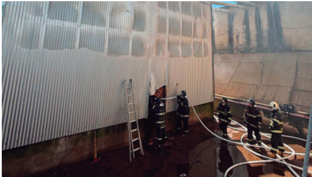
Explosão foi registrada em indústria de amendoim localizada às margens da SP-294

A ocorrência foi registrada em uma indústria de amendoim localizada na altura do km 493 da rodovia, na área rural do município, no distrito de Paulópolis. Segundo informações divulgadas pelas equipes que atuaram no atendimento,