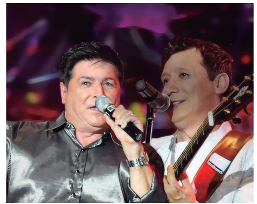
Dupla foi confirmada como atração