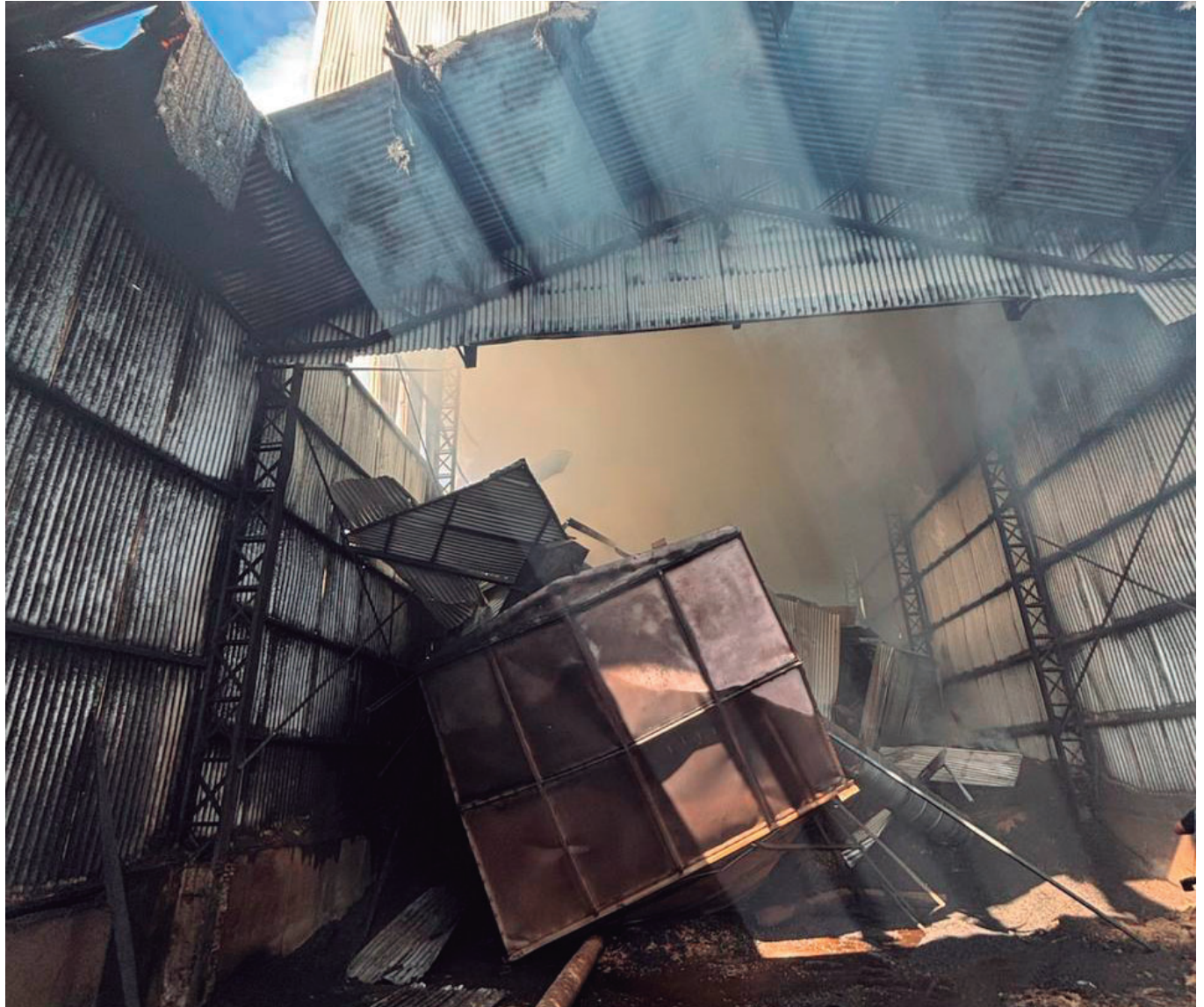
Acidente em indústria de amendoim mobilizou resgate e deixou dez feridos em Pompeia, cinco deles em estado grave