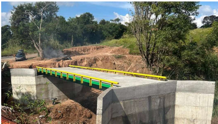
A previsão é que a obra seja finalizada nos próximos 30 dias no distrito de Avencas

tratégica para a mobilidade da zona rural do município e para o escoamento da produção agrícola. Pelo local circulam diariamente moradores da região, além de veículos utilizados no