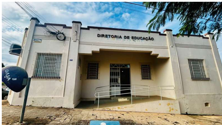
Inscrições podem ser realizadas até este dia 30, na Diretoria Municipal de Educação

A seleção prevê contratação temporária por até 12 meses, com possibilidade de prorrogação por igual período, conforme a necessidade da administração municipal.