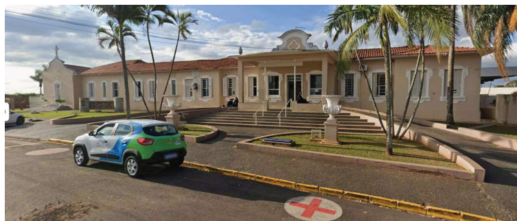
Além de sistema contra incêndio, reforma contempla reparos de infraestrutura