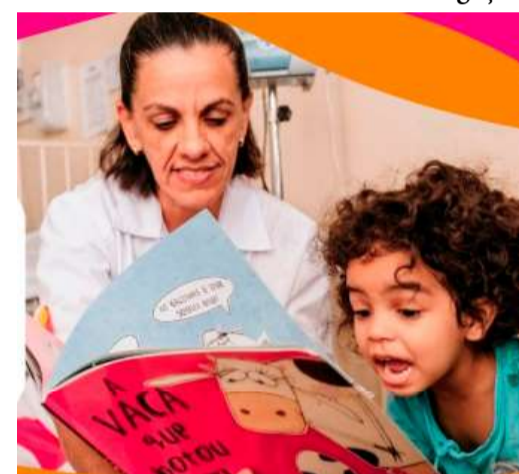
Entidade atua em Marília desde 2007

Valor da publicação: R$ 28,00. Conforme Lei Municipal Nº 2.650, de 30 de março de 2016