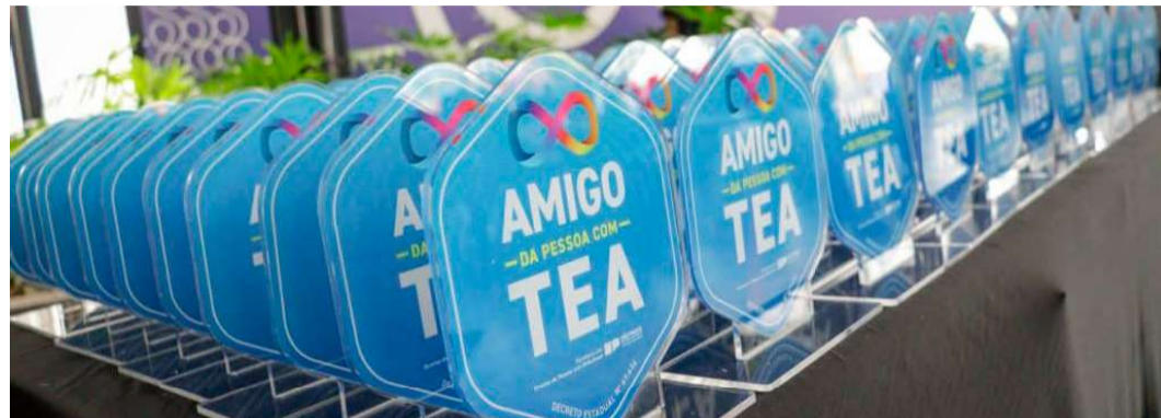
Projeto ‘Movimente’ foi reconhecido pelo Governo do Estado de São Paulo