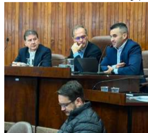
Audiência pública foi realizada no dia 29