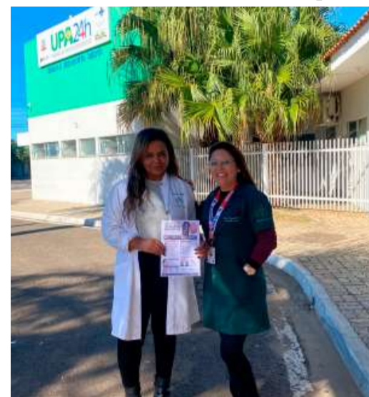
Ação foi realizada na última semana