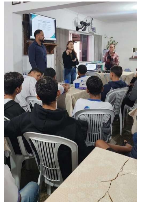
Orientação sobre autocuidado e segurança digital reuniu jovens