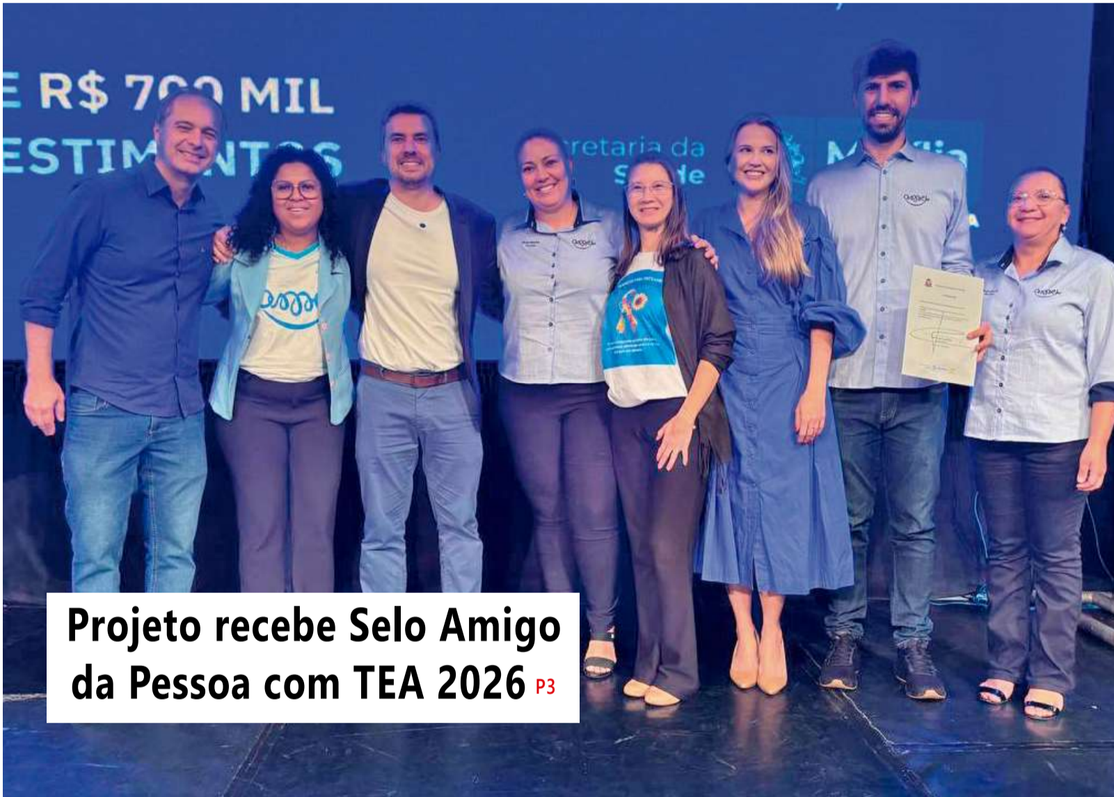
Projeto recebe Selo Amigo da Pessoa com TEA 2026 P3