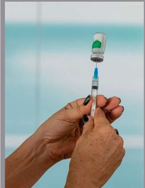
Saúde libera vacina contra gripe para toda a população de Marília