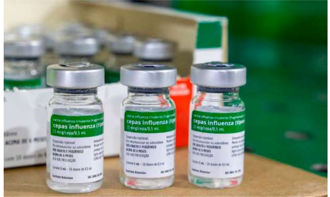
A vacina está disponível gratuitamente nas unidades de saúde do município