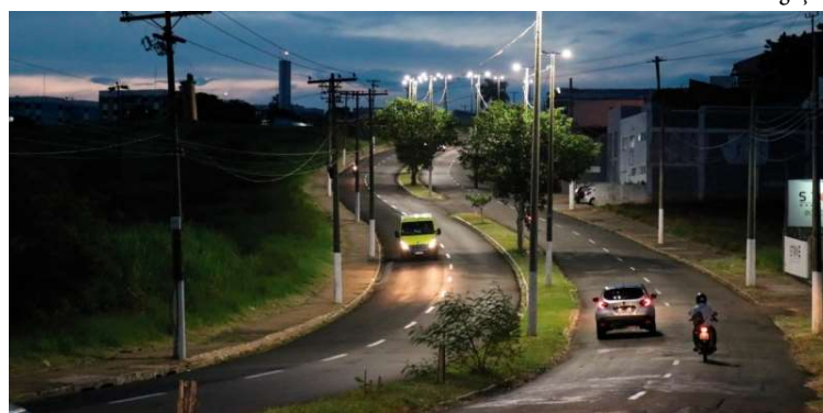
De acordo com o edital, consulta pública tem caráter informativo e consultivo

A administração municipal avalia que a modelagem por meio de PPP pode ampliar a capacidade de investimento e acelerar a adoção de tecnologias, consolidando bases para uma cidade mais conectada, eficiente e preparada para futuras soluções de monitoramento e gestão urbana.