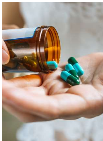
Processo está programado para o dia 13

sistema de registro de preços pela oscilação na demanda por medicamentos, influenciada por fatores como sazonalidade de doenças, mudanças em protocolos clínicos e quantidade de pacientes atendidos nas unidades de saúde. Segundo o texto, o modelo permite maior flexibilidade na gestão das aquisições, reduzindo riscos de desperdício, vencimento de produtos e desabastecimento.