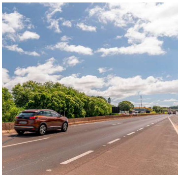
Na região, o pacote inclui R$ 28 milhões

nados a obras em rodovias concedidas e outros R$ 18,6 milhões para intervenções em vias sob responsabilidade do DER-SP.