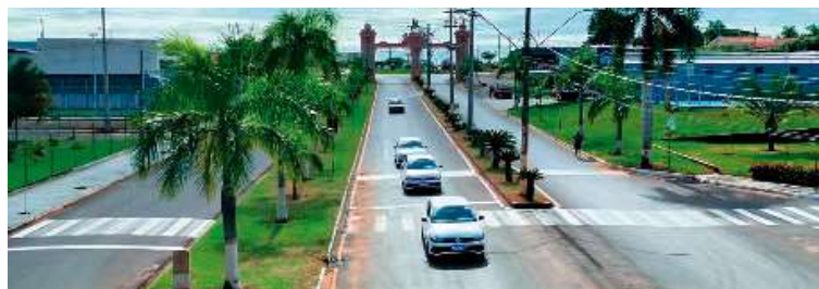
Município recebeu três veículos zero quilômetro destinados à área da saúde