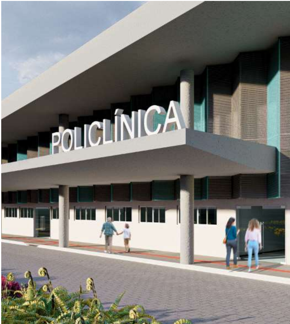
Inicialmente estimada em R$ 21,2 milhões, a contratação foi homologada por valor cerca de R$ 1,16 milhão inferior