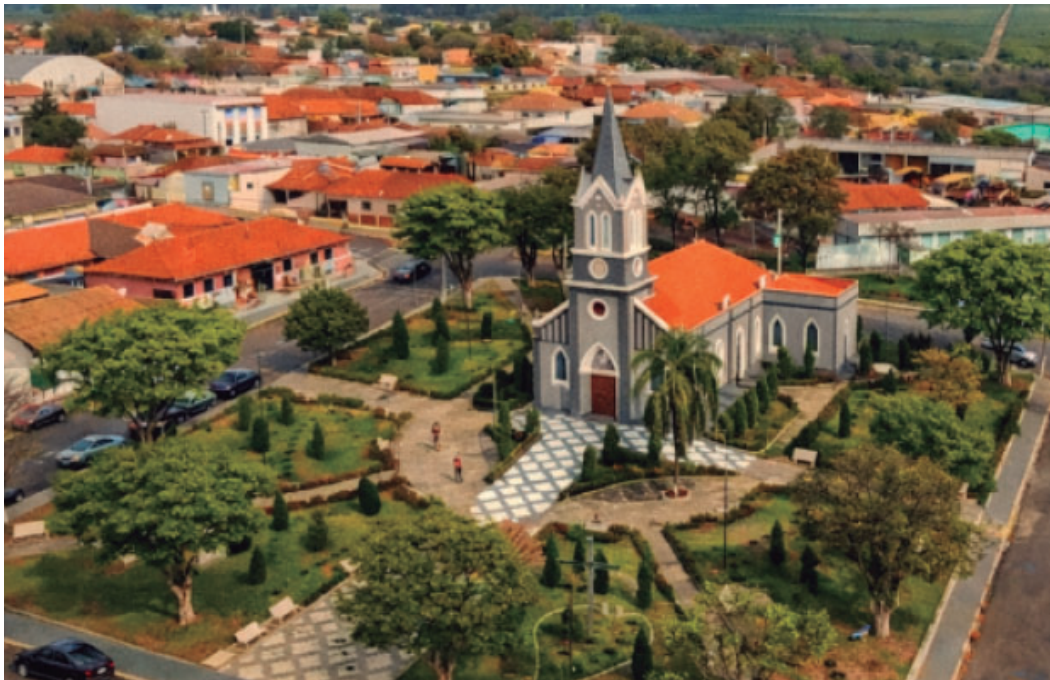
Município de Ubirajara será contemplado com uma nova Unidade Básica de Saúde

Segundo as informações divulgadas pela administração municipal, a nova UBS representa mais estrutura, qualidade no atendimento e dignidade para as famílias ubirajarenses. A unidade deverá contribuir