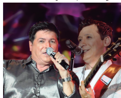
Dupla foi confirmada como atração