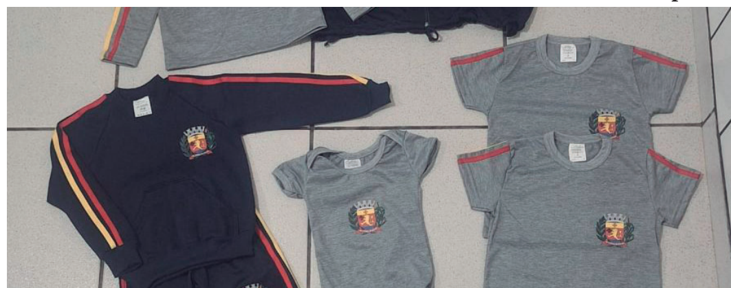
Kits completos foram entregues aos alunos das escolas municipais e da creche

Valor da publicação: R$ 28,00. Conforme Lei Municipal Nº 2.650, de 30 de março de 2016