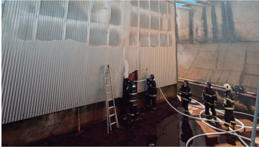
Explosão foi registrada em indústria de amendoim localizada às margens da SP-294

A ocorrência foi registrada em uma indústria de amendoim localizada na altura do km 493 da rodovia, na área rural do município, no distrito de Paulópolis. Segundo informações divulgadas pelas equipes que atuaram no atendimento,