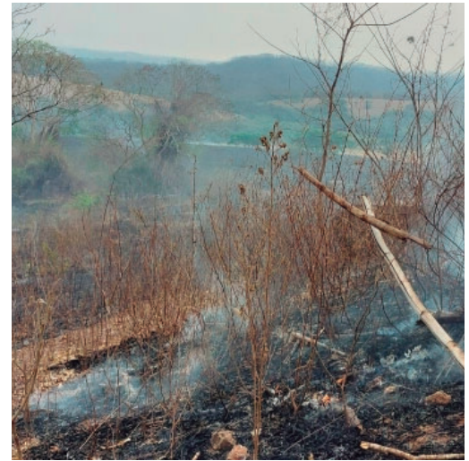
Iniciativa contra queimadas será no dia 29