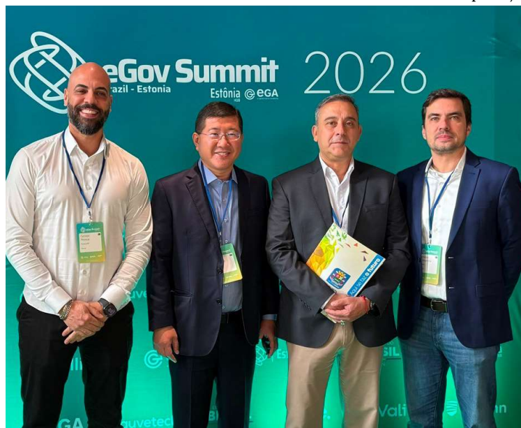
Parceria com o Estônia Hub vai mapear a maturidade digital do município

O levantamento deverá analisar diferentes áreas da administração municipal, incluindo governança digital, orçamento, inteligência artificial, infraestrutura tecnológica, serviços digitais, transparência, acessibilidade, participação pública e gestão de benefícios sociais. Após o mapeamento, será elaborado um re-