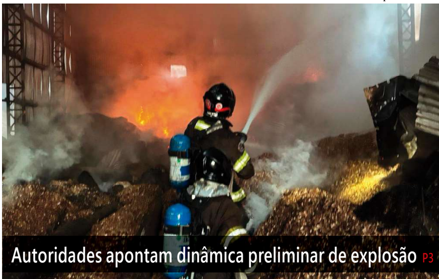
Autoridades apontam dinâmica preliminar de explosão P3