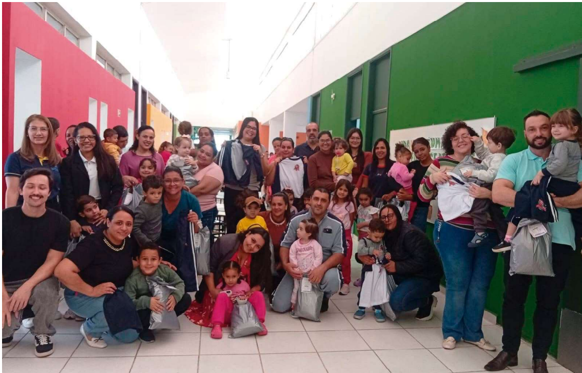
Oriente distribui uniformes para os alunos da rede municipal P2