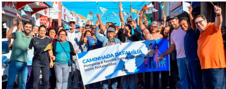
Registro de edição anterior da Caminha da Família; evento será no dia 16

Com o tema “Pompeia é família: passos unidos e laços fortalecidos”, a caminhada terá início