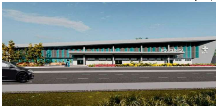
Projeto da nova Policlínica em Marília; valor oferece economia aos cofres públicos

Segundo o termo de adjudicação e homologação publicado junto ao processo licitatório, o valor vencedor da concorrência eletrônica foi de R$ 20.064.000,00. A empresa ficará responsável pela execução completa da obra, incluindo fornecimento de materiais, mão de obra, equipamentos e demais serviços previstos nos