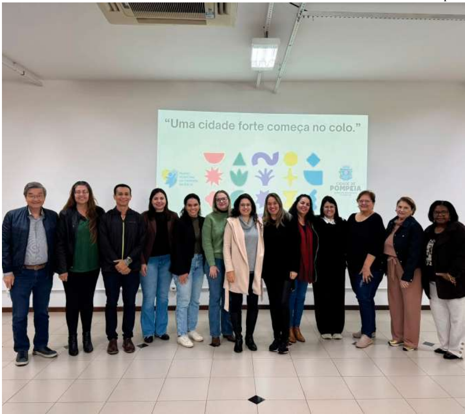
Plano da Primeira Infância prevê estratégias para ampliar rede de proteção e acompanhamento de crianças em Pompeia