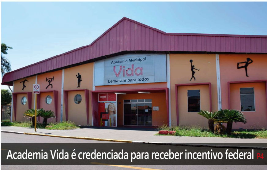
Academia Vida é credenciada para receber incentivo federal P4