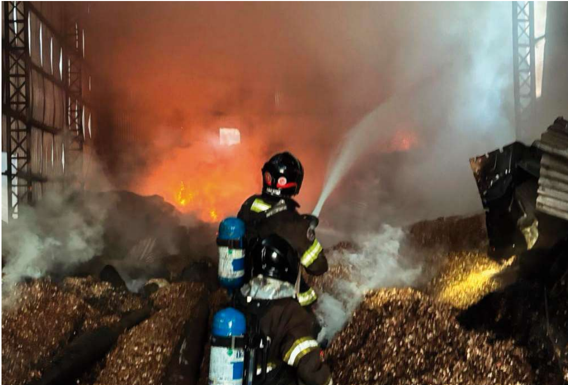
Levantamentos iniciais indicam que incêndio em equipamento antecedeu explosão que matou trabalhador em empresa cerealista