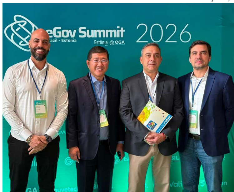
Parceria com o Estônia Hub vai mapear a maturidade digital do município

O levantamento deverá analisar diferentes áreas da administração municipal, incluindo governança digital, orçamento, inteligência artificial, infraestrutura tecnológica, serviços digitais, transparência, acessibilidade, participação pública e gestão de benefícios sociais. Após o mapeamento, será elaborado um re-