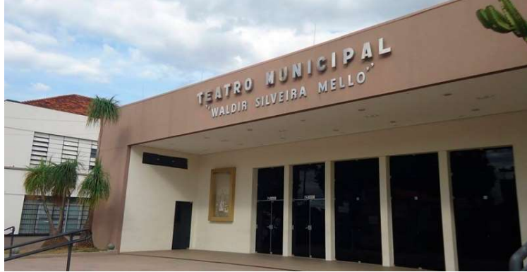
Proposta abre caminho para que Marília possa executar mais ações culturais

Na prática, a proposta abre caminho para que Marília possa receber recursos estaduais voltados ao custeio de atividades culturais e iniciativas destinadas