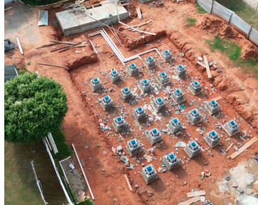
Praça terá fontes interativas de água

tamente do chão, permitindo que crianças e adultos circulem pelo espaço, utilizem a estrutura para recreação e se refresquem durante os períodos de calor. A proposta busca unir lazer, urbanismo e conforto térmico em um ambiente acessível e gratuito.