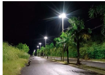
Iluminação adequada promove segurança