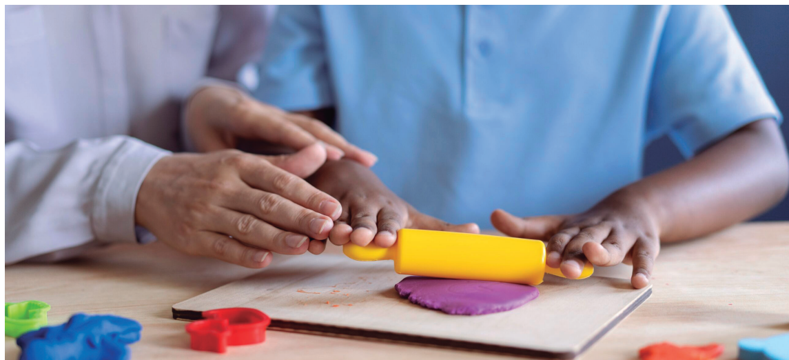
O atendimento será realizado em creches, pré-escolas e escolas de ensino fundamental da rede municipal de Marília