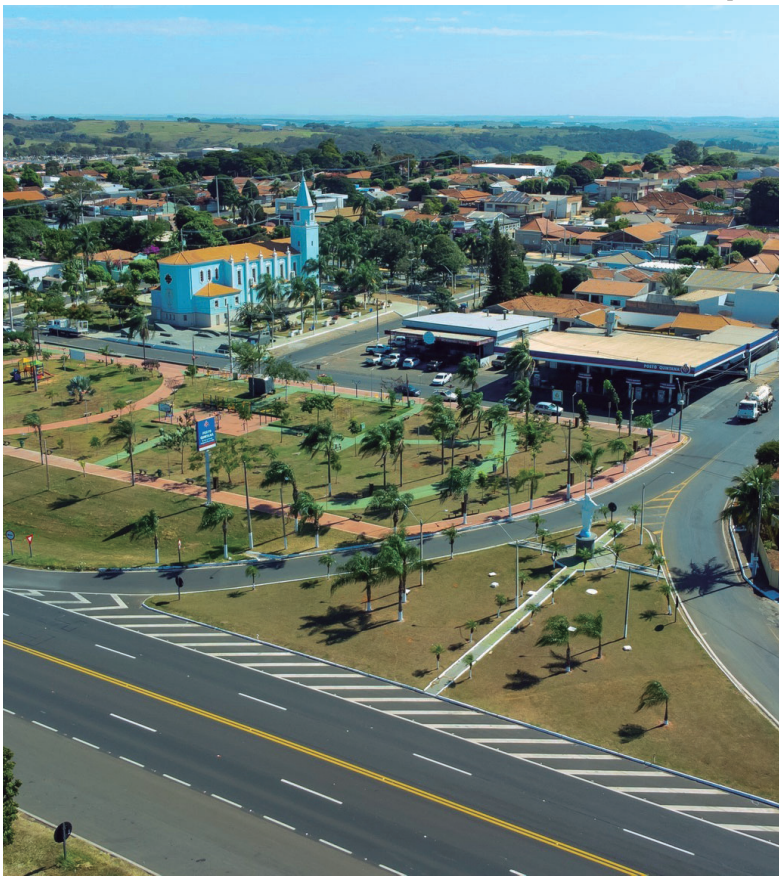
Mesmo sem registrar mortes no trânsito este ano, Quintana reforçou ações do Maio Amarelo