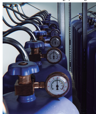
Itens serão destinados à UBS e ao Samu