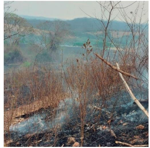
Iniciativa contra queimadas será no dia 29