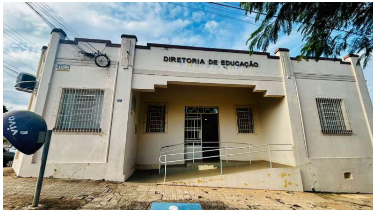
Inscrições podem ser realizadas até este dia 30, na Diretoria Municipal de Educação

A seleção prevê contratação temporária por até 12 meses, com possibilidade de prorrogação por igual período, conforme a necessidade da administração municipal.