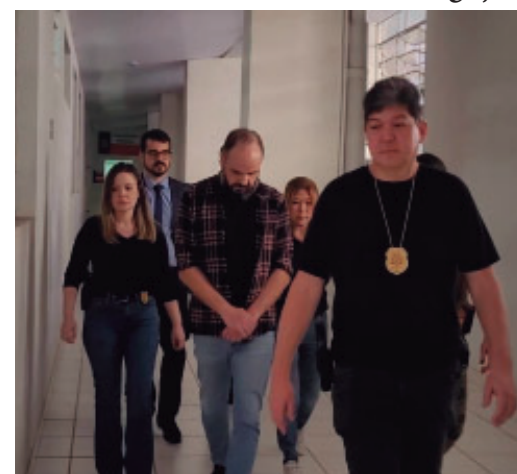
Médico já estava preso preventivamente