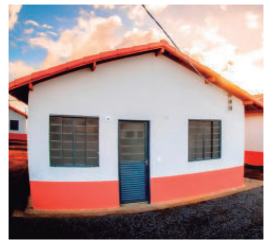
Autorização garante início das obras