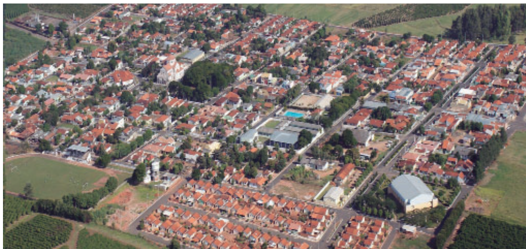
Vista do município de Lupércio; edital prevê disponibilização de sistemas integrados

De acordo com o edital, a contratação prevê a disponibilização de sistemas integrados para atender às necessidades dos Poderes Executivo e Legislativo do muni-