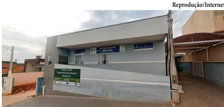
Centro de Saúde de Ubirajara; profissional deve orientar população em atividades

De acordo com o edital, o profissional contratado deverá atuar no desenvolvimento de atividades físicas e práticas corpo-