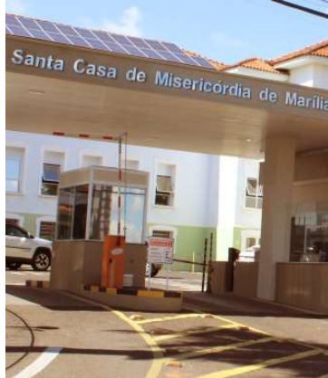
Santa Casa de Marília lidera repasses

dos Direitos da Criança e do Adolescente).