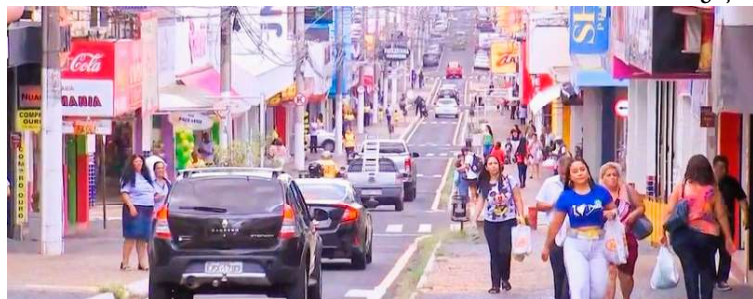
Orientação segue entendimento divulgado pela Federação do Comércio de SP