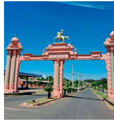
Município licita novos equipamentos