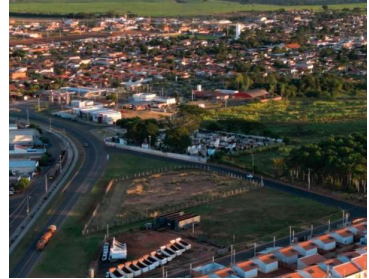
Cidade conquistou Selo A de qualidade