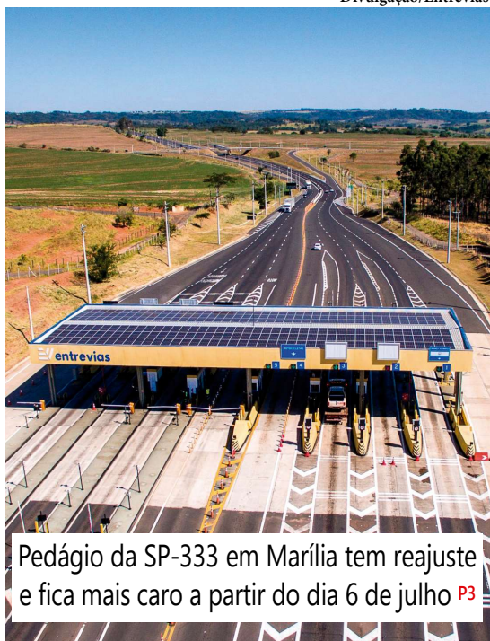
Pedágio da SP-333 em Marília tem reajuste e fica mais caro a partir do dia 6 de julho P3