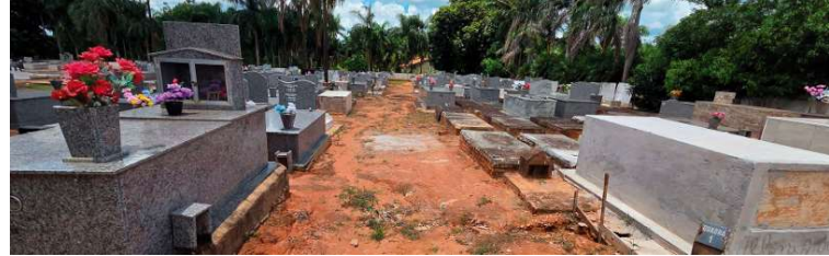
Relatório mostra trechos com piso de terra, desníveis e passagens sem calçamento

em concreto, com espessura de 7 centímetros, lastro de brita, cortes de dilatação e acabamento desempenado. O projeto também prevê o uso de tela de aço soldada, conforme a necessidade do local.