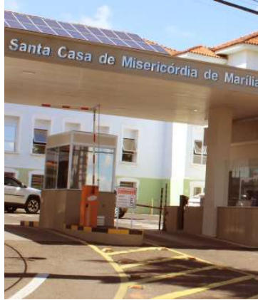
Santa Casa de Marília lidera repasses

dos Direitos da Criança e do Adolescente).