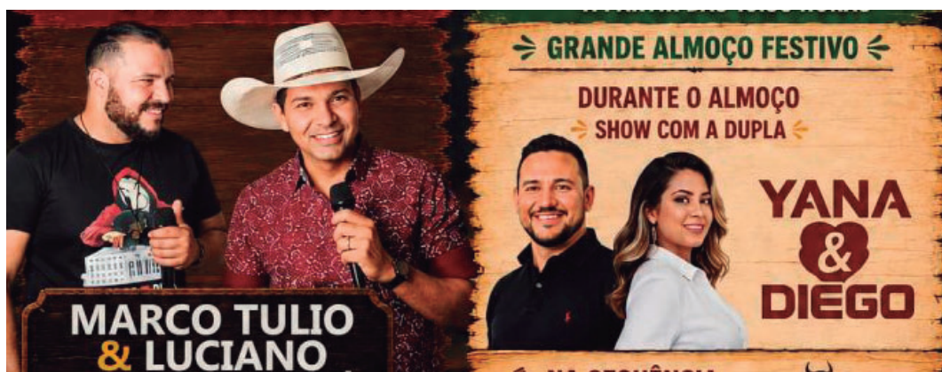
Festividades começam no sábado, 6 de junho, com show de Marco Tulio & Luciano