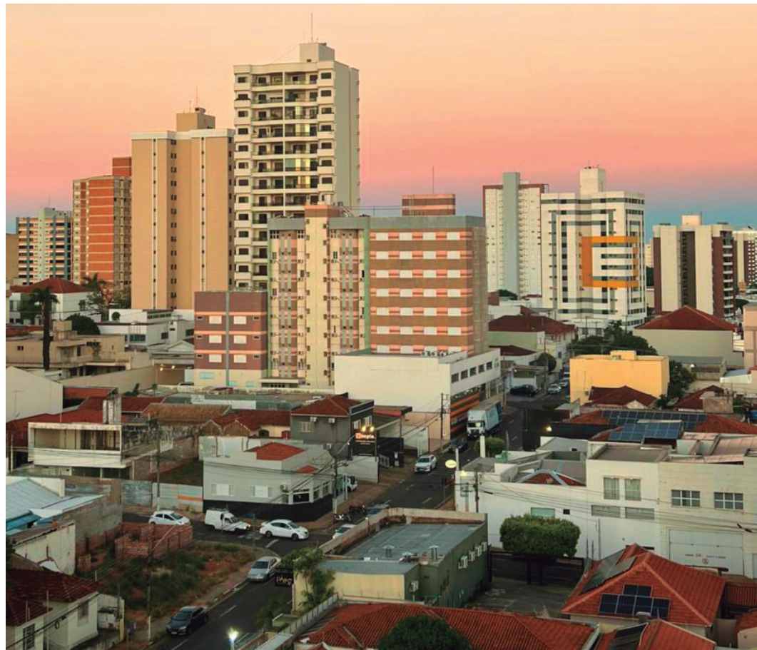
Saúde de Marília vai receber reforço com repasse federal autorizado em nova portaria

A prestação de contas deverá ser realizada pelos municípios por meio do Relatório Anual de Gestão, conforme determina a legislação do SUS (Sistema Único de Saúde).