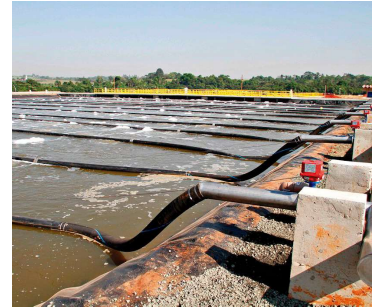
Levantamento avaliou 2.558 municípios

Valor da publicação: R$ 8,12. Conforme Lei Municipal Nº 2.650, de 30 de março de 2016