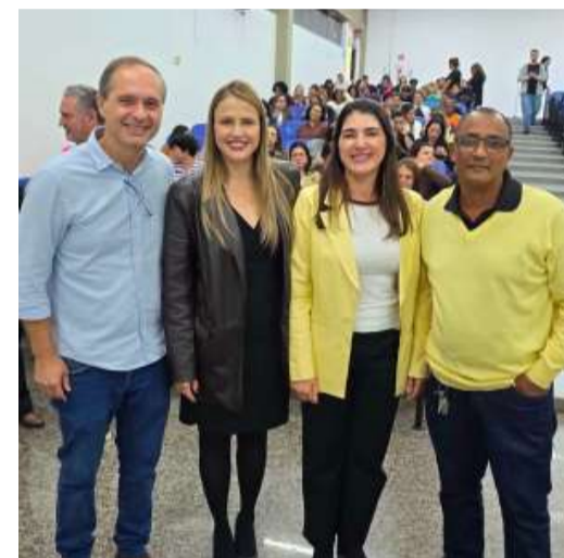
Iniciativa teve parceria com a Unimar