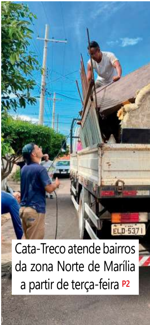
Cata-Treco atende bairros da zona Norte de Marília a partir de terça-feira P2