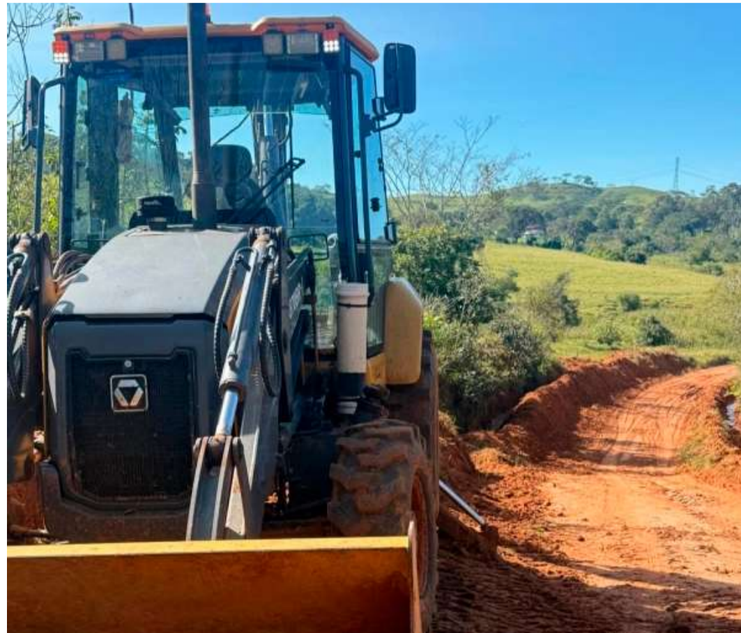
Prefeitura realiza melhorias em estradas rurais para garantir segurança e conservação

Segundo a administração municipal, os serviços fazem parte das ações de manutenção preventiva realizadas na zona rural. A Prefeitura destaca que intervenções desse tipo ajudam a evitar problemas maiores, garantem mais durabilidade às estradas e favorecem o deslocamento da população e o escoamento da produção agrícola.