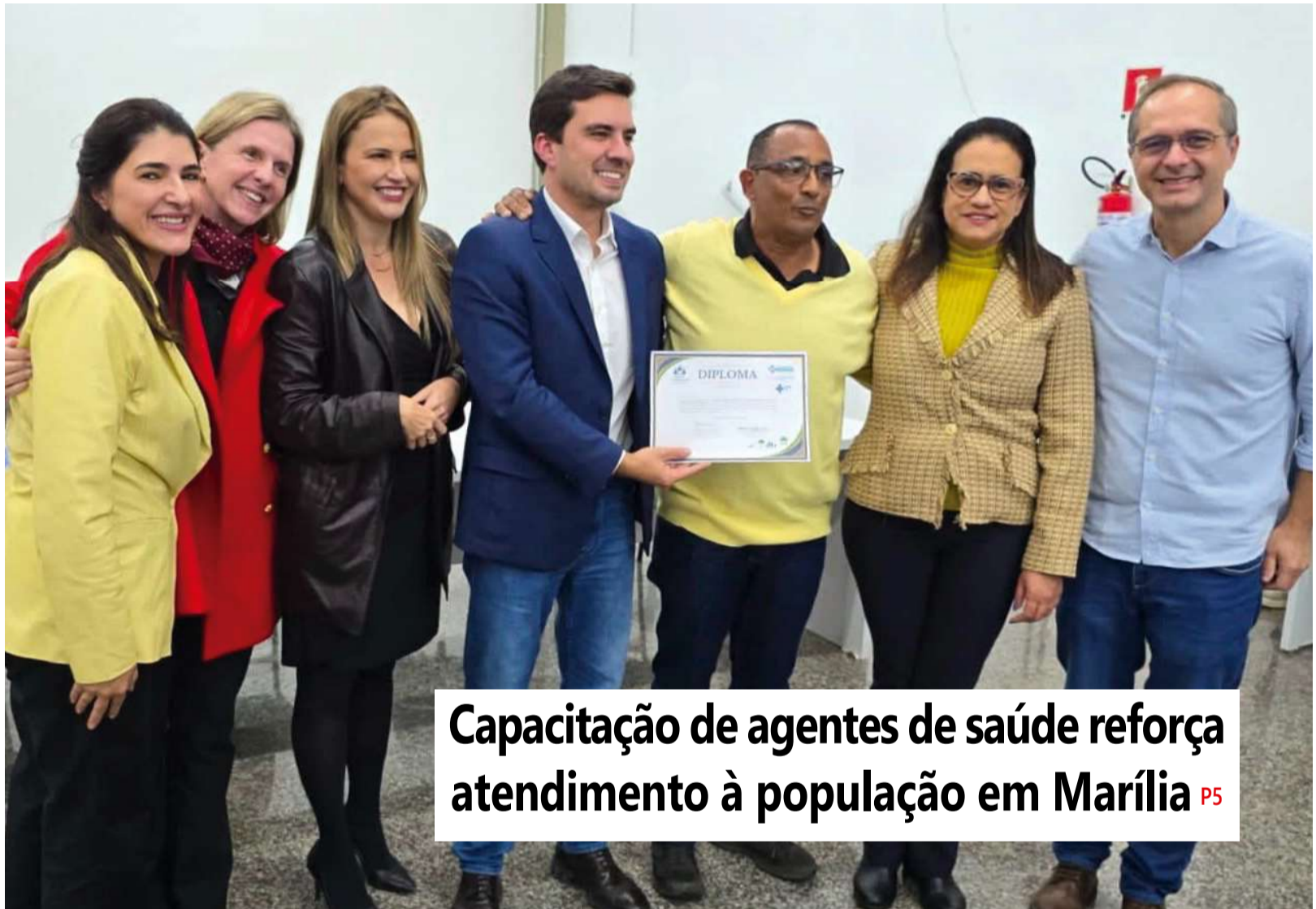
Capacitação de agentes de saúde reforça atendimento à população em Marília P5