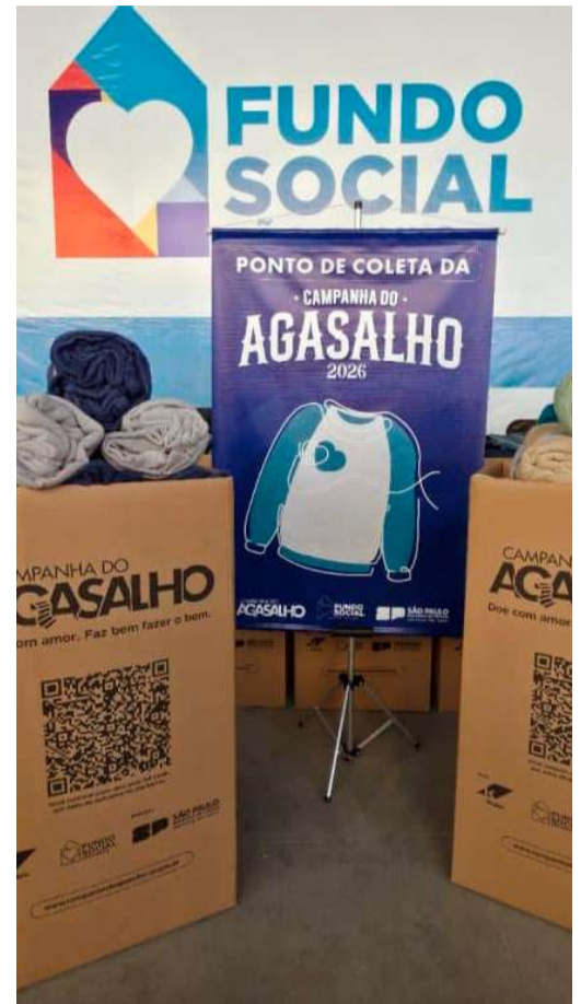
Inverno impulsiona campanha em SP