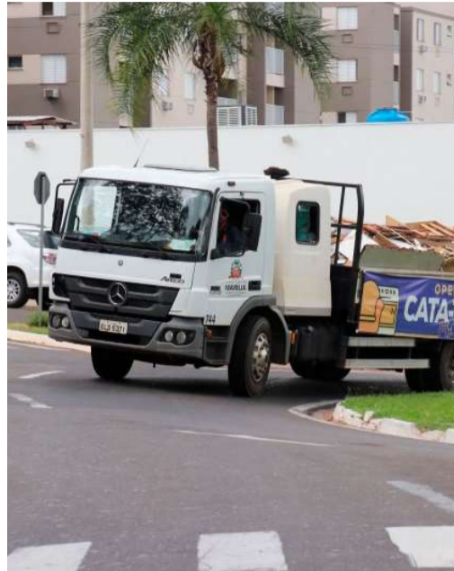
Operação inicia nova etapa no dia 23

Entre os materiais que podem ser recolhidos estão móveis inutilizados, eletrodomésticos quebrados, sucatas, colchões e