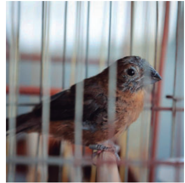
Traficantes ilegais adulteram anilhas

Valor da publicação: R$ 56,00. Conforme Lei Municipal Nº 2.650, de 30 de março de 2016