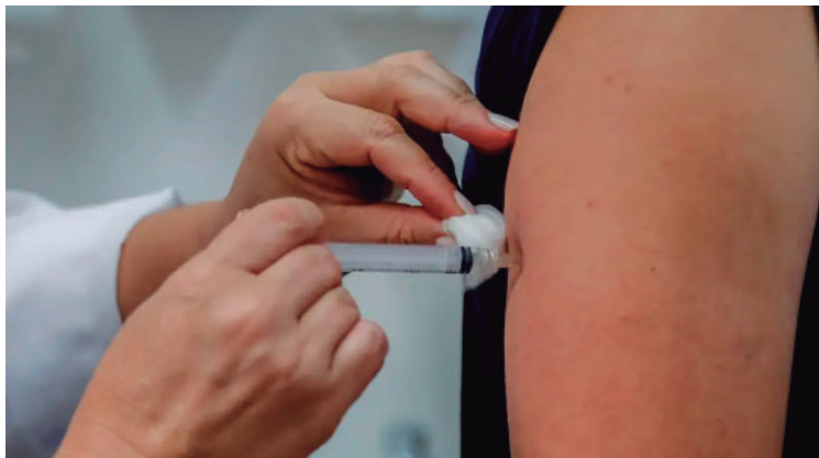
Ação é voltada a toda a população e ocorre entre os dias 29 de junho e 3 de julho

A campanha municipal tem a participação da Acim (Asso-