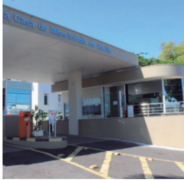
Hospital emitiu nota sobre alta ocupação

Segundo o hospital, a sobrecarga atinge temporariamente a estrutura de assistência intensiva, área destinada ao atendimento de pacientes em estado mais grave ou que exigem acompanhamento contínuo e maior suporte das equipes de saúde. A instituição informou que a situação está re-