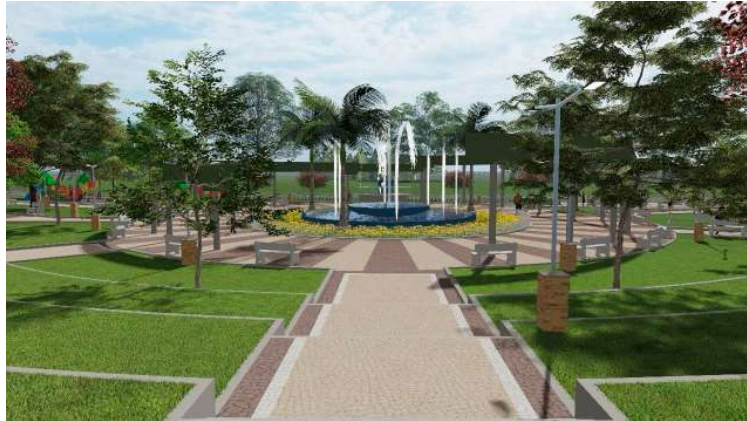
Praça é reconhecida como um dos principais cartões-postais do município

Reconhecida como um dos principais cartões-postais de Pompeia, a Praça Jesus Maria