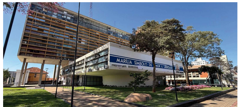
Município de Marília registrou grande avanço no ranking nos últimos dois anos