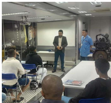
Aulas ocorrem na Escola Móvel do Senai