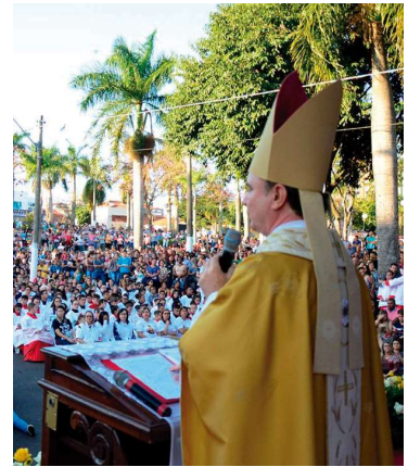
Registro da celebração em ano anterior