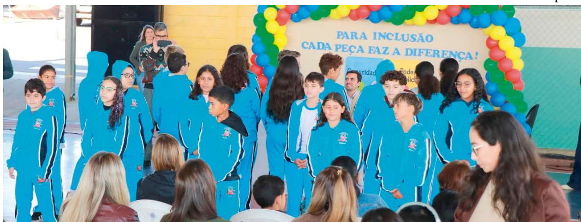
A cerimônia oficial de entrega ocorreu na Emef Governador Mário Covas, no Jardim Julieta, região Norte da cidade

O equipamento tem como objetivo reduzir os impactos provocados por estímulos sonoros intensos no ambiente escolar, contribuindo para o conforto, a autorregulação e a participação dos alunos nas atividades pedagógicas. A iniciativa integra o projeto “Educação Acolhedora”, desenvolvido pela Secretaria Municipal da Educação.