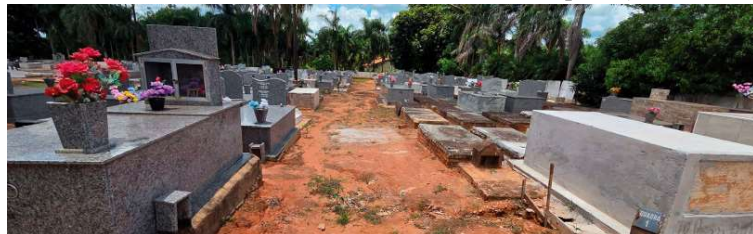
Relatório mostra trechos com piso de terra, desníveis e passagens sem calçamento

em concreto, com espessura de 7 centímetros, lastro de brita, cortes de dilatação e acabamento desempenado. O projeto também prevê o uso de tela de aço soldada, conforme a necessidade do local.