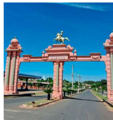
Município licita novos equipamentos