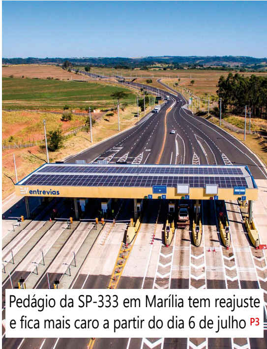
Pedágio da SP-333 em Marília tem reajuste e fica mais caro a partir do dia 6 de julho P3