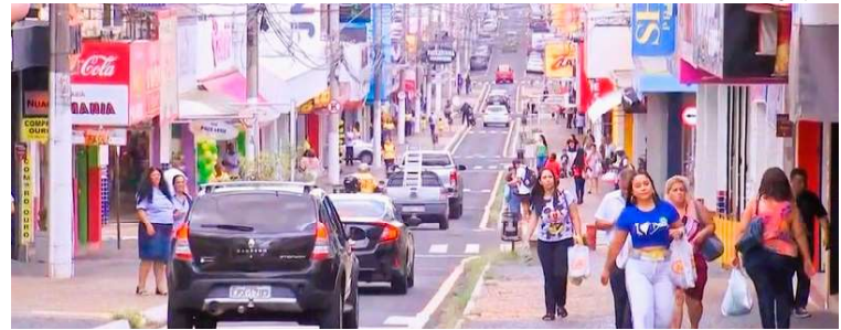
Orientação segue entendimento divulgado pela Federação do Comércio de SP