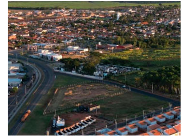
Cidade conquistou Selo A de qualidade