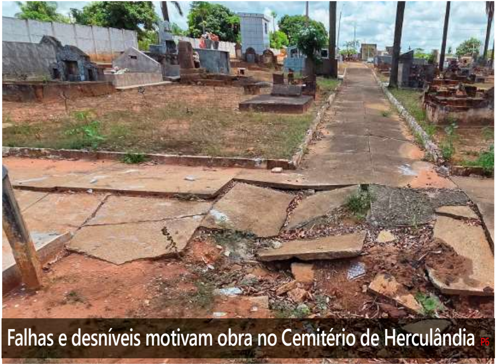
Falhas e desníveis motivam obra no Cemitério de Herculândia P6