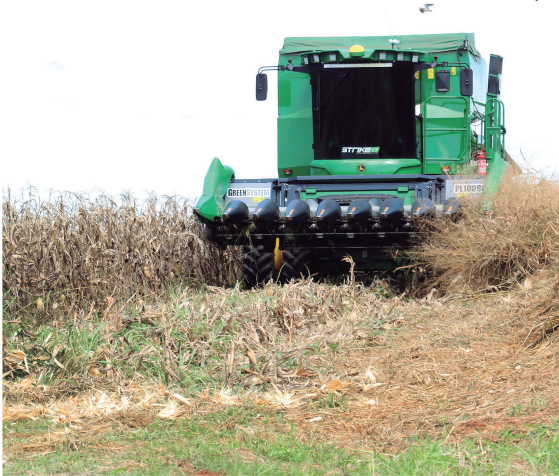
Iniciativa reúne Direito, Tecnologia e Agronegócio para facilitar o acesso de pequenos produtores rurais ao mercado europeu de forma prática

Quintana tem 96,8% de aproveitamento em ranking do Tesouro P5