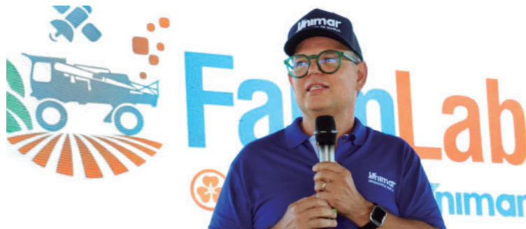
Trabalho foi realizado pelo curso de Direito da Unimar, em parceria com o FarmLab

O trabalho foi realizado na disciplina de Direito Digital, por meio da extensão curricularizada, em parceria com o FarmLab, ambiente de inovação resultado da colaboração entre a Jacto e a Unimar. Durante o semestre, os acadêmicos elaboraram pesquisas e análises jurídicas que ser-