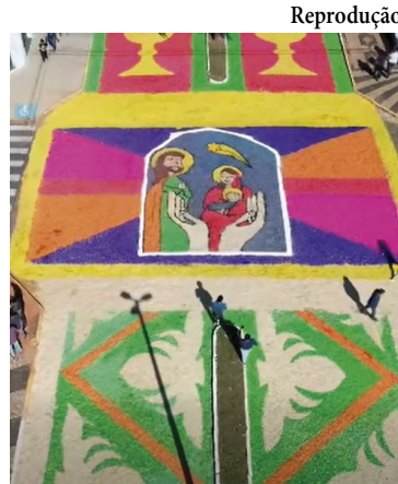
Tradicionais tapetes pelas ruas da cidade

Além do significado religioso para os católicos, a ce-