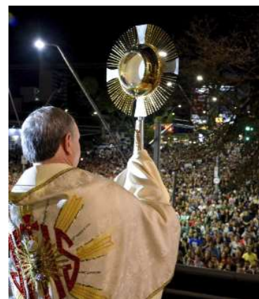
Celebração reuniu milhares em Marília