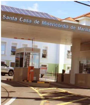
Santa Casa de Marília lidera repasses

dos Direitos da Criança e do Adolescente).