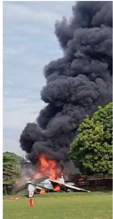
Aeronave de pequeno porte caiu na AABB, logo após decolar do aeroporto; terceiro ocupante foi socorrido com vida