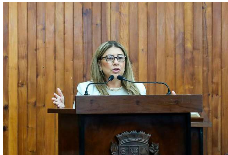
Vice-presidente da Câmara convida a população a participar da audiência