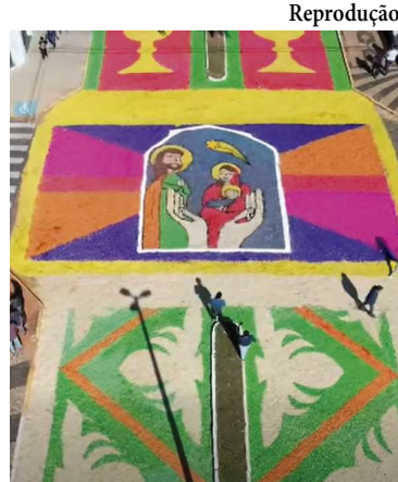
Reprodução Tradicionais tapetes pelas ruas da cidade

Além do significado religioso para os católicos, a ce-