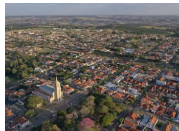
PL tramita na Câmara de Vera Cruz