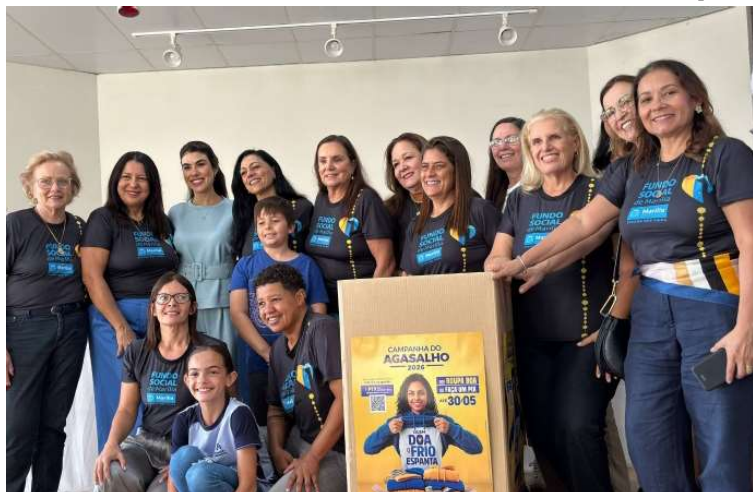
Arrecadação superou o ano passado, com mais de 24 mil agasalhos e 5 mil cobertores