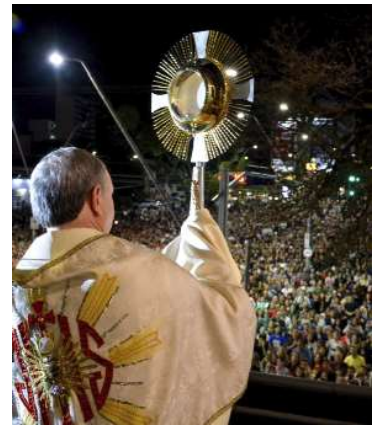
Celebração reuniu milhares em Marília