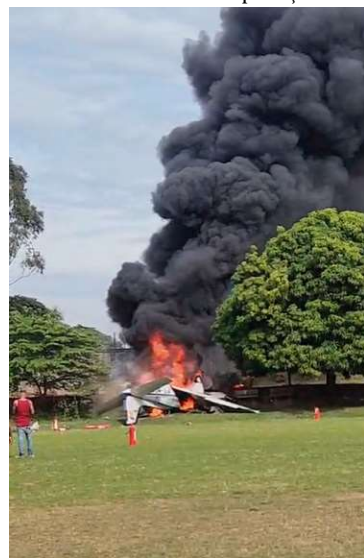
Aeronave de pequeno porte caiu na AABB, logo após decolar do aeroporto; terceiro ocupante foi socorrido com vida