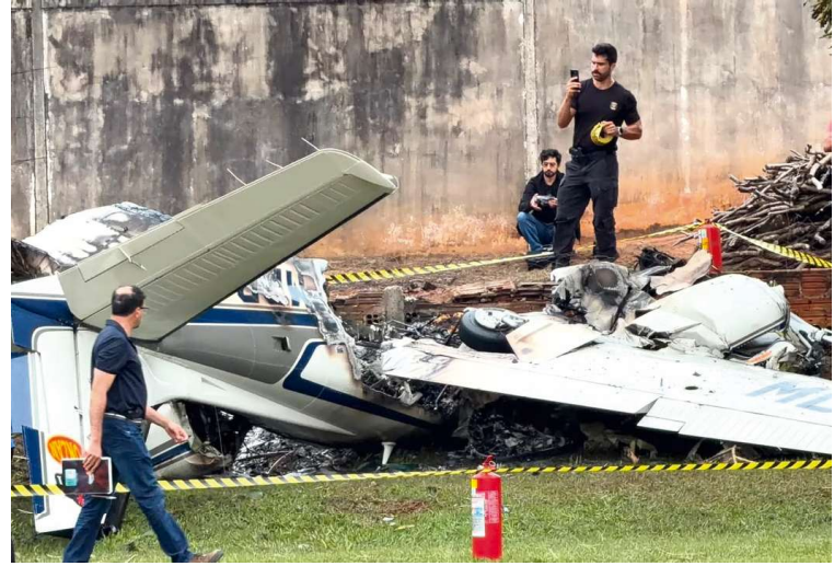
Avião de pequeno porte caiu no campo de futebol da AABB nesta quarta-feira (10)