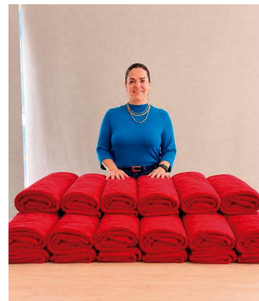
Gleise agradeceu o apoio do Estado