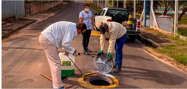
Operação consiste na aplicação de produtos específicos em todos os poços de visita

A operação consiste na aplicação de produtos específicos nos PVs (poços de visita) da rede de esgoto. A medida forma uma barreira química que ajuda a impedir a saída de ratos, baratas e escorpiões para áreas residenciais, reduzindo os riscos de infestação e contribuindo para ambientes mais seguros.