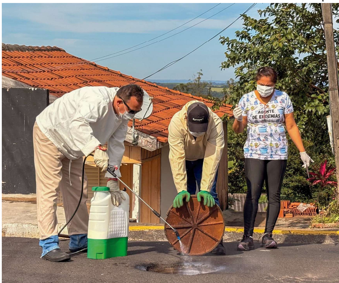
Vigilância Sanitária de Pompeia iniciou uma ação de desratização e controle de baratas e escorpiões na rede de esgoto do município