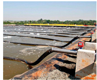
Levantamento avaliou 2.558 municípios

Valor da publicação: R$ 8,12. Conforme Lei Municipal Nº 2.650, de 30 de março de 2016